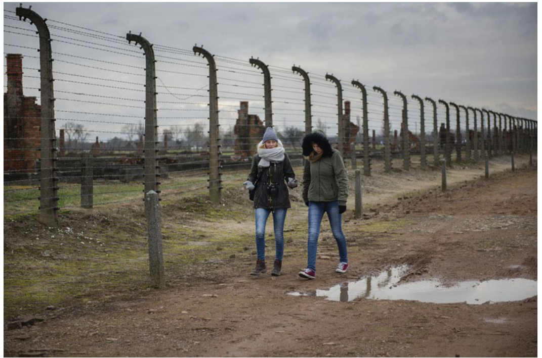
Birkenau, op het pad dat naar de gaskamers leidde.

Auschwitz vlakt levensbeschouwelijke verschillen uit én het verdiept tegelijkertijd het letterlijke beschouwen van het leven (en de dood). 'Ik denk dat er paradoxaal genoeg