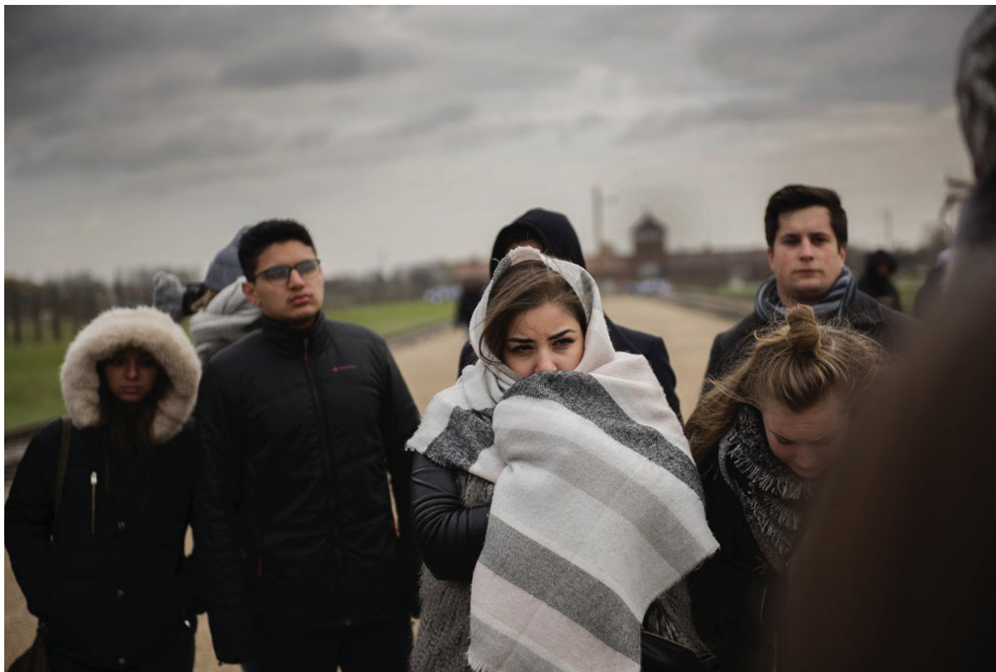
De confrontatie met de plek waar de SS'ers de pas gearriveerden selecteerden.

Eerder dit jaar trok Debaets met een groep leerlingen – de helft christelijk, de helft moslim – van het Imelda-Instituut naar Israël en Palestina ( ds Weekblad 15 april ). Het gezelschap vandaag in Auschwitz is ge-